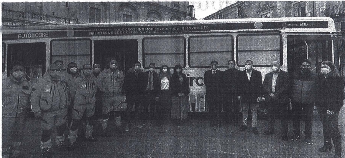
Foto di gruppo ieri in piazza Università dove ha preso il via l’iniziativa natalizia “Librincircolo a Natale”, promossa da Amt e Amas

Per partecipare basterà acquistare libri, giochi o versare un contributo volontario alla lista “Librincircolo a Natale” presso le attività